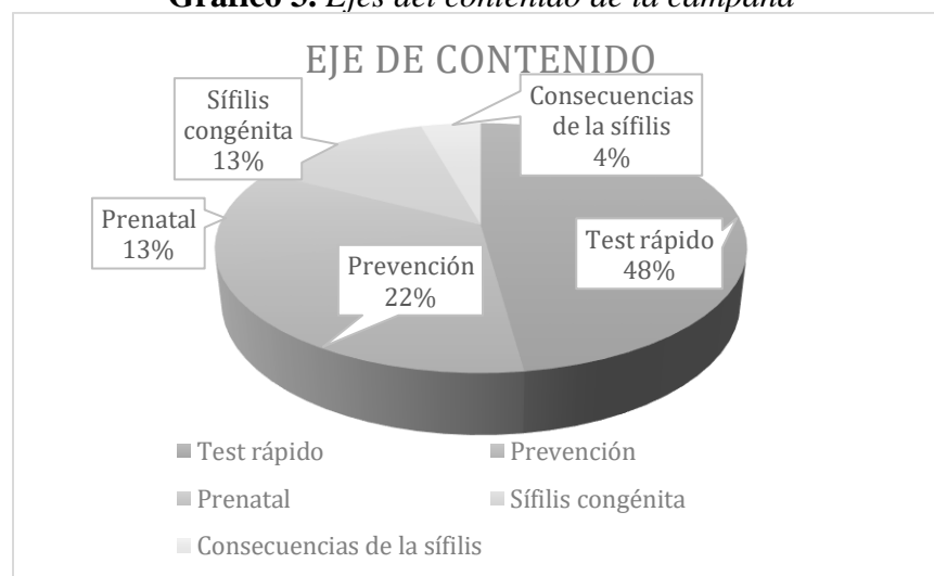
Gráfico 3. Ejes del contenido de la campaña

La figura 3 sistematiza los ejes de contenido que se abordaron durante la campaña. Aunque todo el concepto, los objetivos y las estrategias de la campaña se guían por el tema de la sífilis congénita, es el test rápido el que aparece como el tema más mencionado en las publicaciones. Destacamos que la campaña abordó los siguientes temas: test rápido (11); prevención (5); prenatal (3); sífilis congénita (3) y consecuencias de la sífilis congénita (1). Los temas se abordaron por separado o juntos en la misma publicación, destacando siempre la importancia de realizar el test rápido como forma de prevenir a la madre y al bebé de las consecuencias de la sífilis.